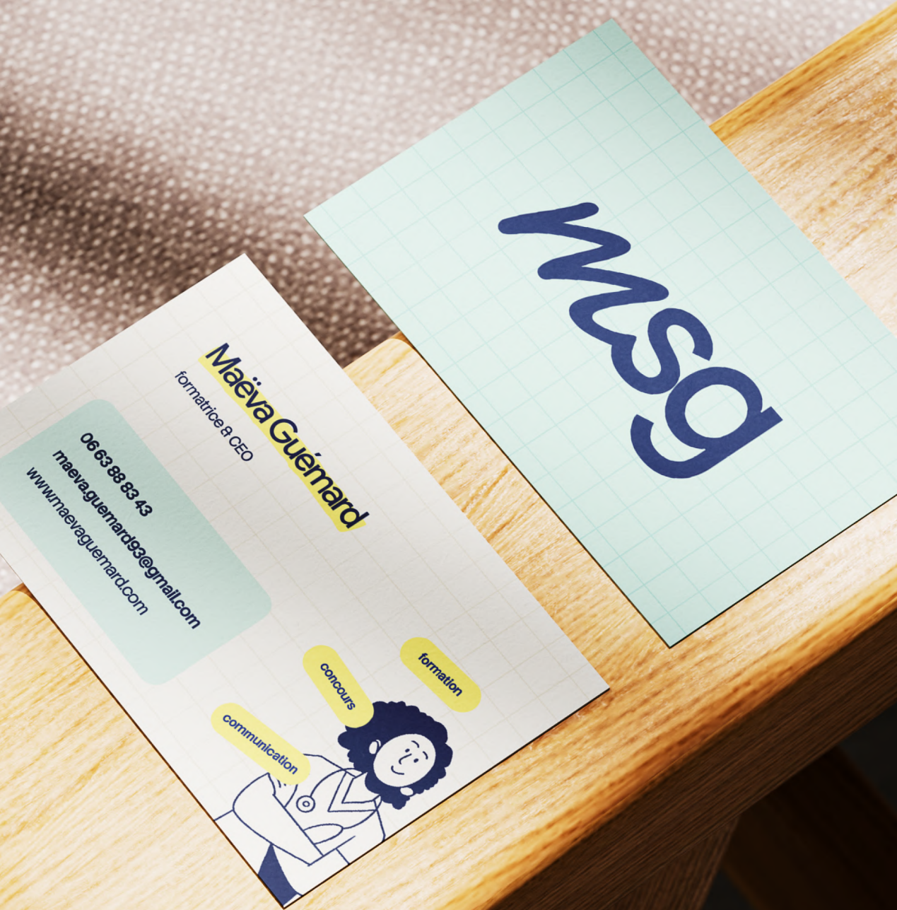
Projection print Carte de visite + livre